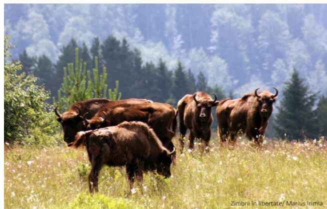
Zimbrii în libertate/ Marius Irimia